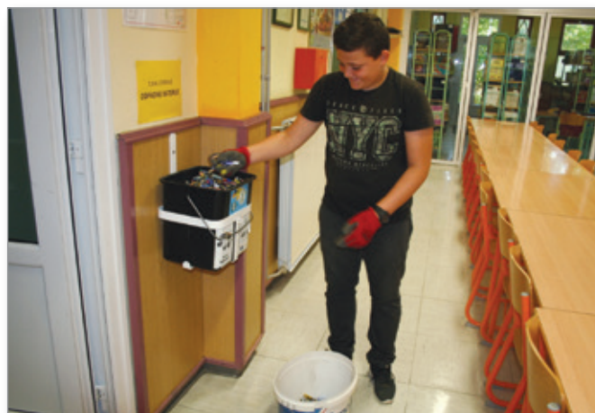
Akcija zbiranja odpadnih baterij

Na Osnovni šoli Cerkevjak–Vitomarci se je od leta 2003 skozi program Ekošola zvrstilo veliko število projektov: zbirali smo star papir, odpadne baterije in elektronsko opremo, pripravili radijske ure na temo trajnostnega ravnanja z okoljem, merili odtis CO 2 , se seznanjali o pomenu krožnega gospodarstva, odpadkom smo dajali novo življenje, mladi poročevalci so objavljali svoje članke v šolskem Ekolistu in pripravili radijske oddaje na temo varovanja okolja, sodelovali smo na ekokvizu, brali literaturo o okolju v projektu ekobranje za ekovivljenje ter izvajali številne druge aktivnosti, s katerimi smo želeli delovati trajnostno.