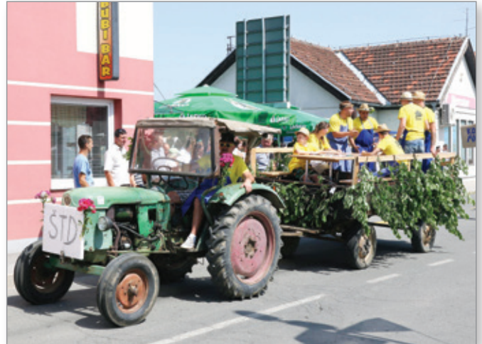
V starih časih so podobno kot danes veliko »del« opravili za mizo – tako kot takrat pa še danes ta »dela« najraje »opravljajo« dedci.

Pred osrednjo proslavo ob 21. občinskem prazniku Občine Cerkevnik, ki je potekala v Kulturnem domu Cerkevnik, je Turistično društvo Cerkevnik pripravilo že tradicionalno »Povorko starih običajev in navad«. Mimohod skupin, ki so bodisi na traktorskih prikolicah ali pa peš na domiselne načine predstavljale stare kmečke običaje in navade v osrednjih Slovenskih goricah, so si poleg domačinov ogledali tudi številni obiskovalci od blizu in daleč. Mnoge je v Cerkevnik pritegnila ravno ta prireditev, saj mladi danes nimajo več veliko priložnosti, da bi videli, kako so nekoč živeli in delali njihovi dedki in babice. Tako kot vsako leto pa je celotni prireditvi dal poseben čar kanček humorja, s katerim so posamezne skupine prikazale stare običaje in navade. S tem so samo ponazorile, kako so si naši dedki in babice znali življenje narediti tudi veselo, čeprav so morali za skromno preživetje trdo in veliko delati. Tudi v hudih časih sta jih po koncu držala neka posebna radost do življenja in smisel za humor, ki ju v gričevnatem svetu med Dravo in Muro nikoli ne zmanjka.