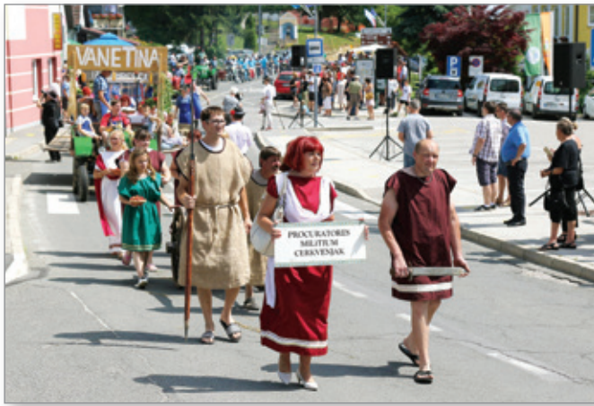
Najbolj poduhovljeni so bili »stari Rimljani«, ki so predstavili tudi kulinarične dobrote iz rimskih časov.