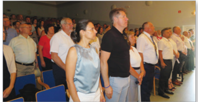
Tako kot vsako leto je tudi letos na začetku proslave zadonela slovenska himna.

Cerkevjačanov) si je ogledalo zelo veliko občank in občanov, zato je bil 21. praznik Občine Cerkevjak zares pravi občinski praznik, saj je v programu prireditvev v njegovem okviru vsakdo našel nekaj zase. K slavnostnemu in prijetnemu vzdušju pa so prispevala tudi druženja po prireditvah, ki so postala že tradicionalna in ki so dala praznovanju še prav poseben pečat.