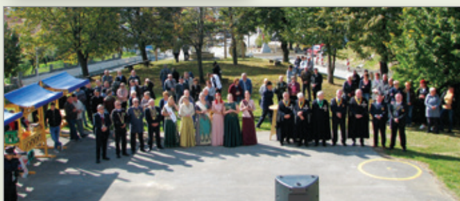
Lep je bil pogled na zbrane in jesensko idilo.