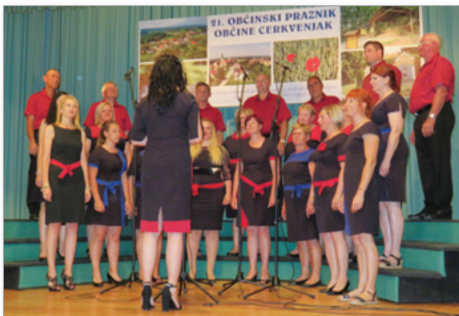
V bogatem kulturnem programu na proslavi je sodeloval tudi mešani pevski zbor Kulturnega društva Cerkevjak.

Tomaž Kšela, foto: arhiv Občine Cerkevjak in T. K.