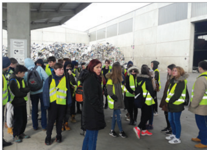
Obisk deponije v Murski Soboti