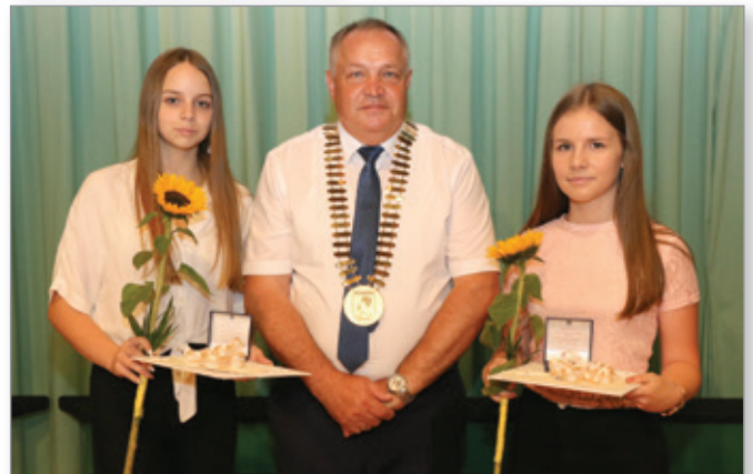
Najboljši učenki sta prejeli županovo petico.