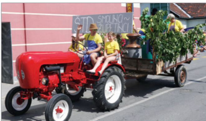
Z dobrima pomočnicama je vožnja s traktorjem lažja.