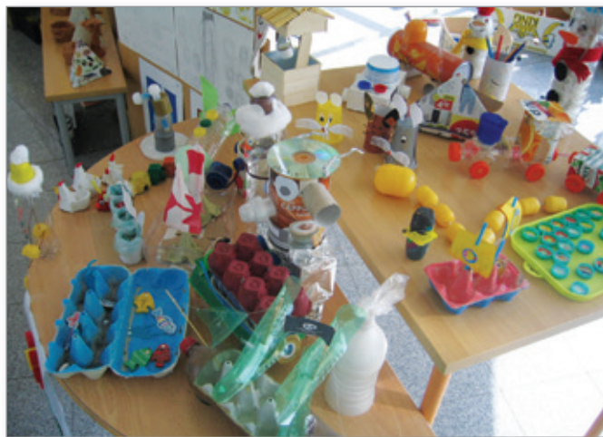
Odpadkom dajemo novo življenje

V šolskem letu 2018/19 je bilo v Sloveniji v ta projekt vključenih 717 ustanov, to je osnovnih in srednjih šol, ekovrtcev ter centrov šolskih in občolskih dejavnosti.