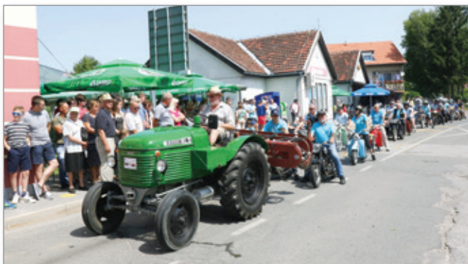
Brez povorke starodobnikov tudi tokrat ni šlo, saj je starejšim dovolj že samo pogled na stare mopede in traktorje, da podoživijo stare čase.

Tekst: Tomaž Kšela