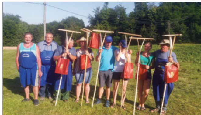
Udeleženci tekmovanja so prejeli simbolične nagrade.