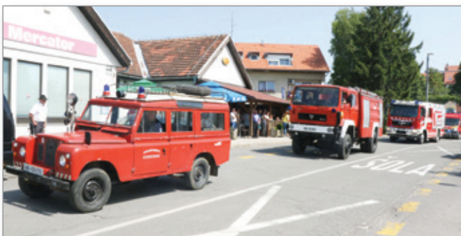
Ob pogledu na člane Prostovoljnega gasilskega društva Cerkevnik in na njihovo sodobno opremo človeka prevzame občutek varnosti.