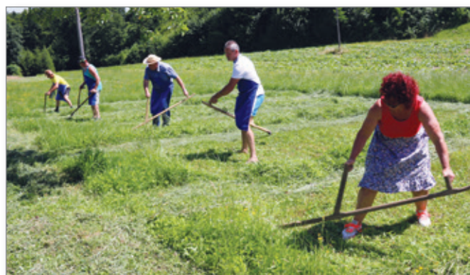
Tako so kosili nekoč.