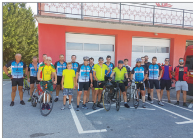
2. kolesarski trim

Mesec avgust je bil za člane društva najbolj aktiven, saj smo 15. 8. 2019 ponovno organizirali kolesarski trim, ki je potekal po mejah Občine Cerkevnik in okoliških občin. Dolžina trase je znašala 40 kilometrov, sama pot pa je bila zelo razgibana. Trim smo s skupnimi močmi, ki smo si jih nabrali na postojankah ob poti, uspešno premagali vsi prijavljeni. Zato gre zahvala tudi gasilskemu društvu Cerkevnik, ki nas je celotno pot spremljalo z vozilom in reševalcem, ki so budno bdeli nad nami. Na koncu kolesarskega trima je sledila obvezna kolesarska malica, makaronovo meso, ki so ga za nas pripravili v Gostišču pri Antonu. Ob dobri hrani in pijači smo se vsi udeleženci strinjali, da se drugo leto ponovno srečamo.