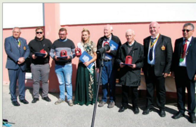
Prejemniki protokolarnega Johanezovega vina