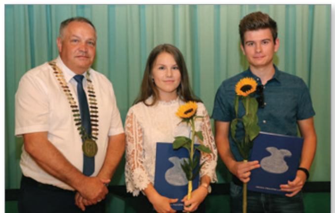
Odlična dijakinja in zlati maturant