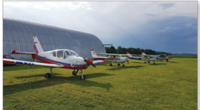
Obramba pred točo iz Cerkevjenjaka

V Aero klubu Sršen iz Cerkevjenjaka, ki vzorno skrbi za vzdrževanje vzletišča (člani sami vsaj dvajsetkrat letno pokosijo celoten kompleks vzletišča, ki se razteza na štirih hektarih zemljišč), so se takoj zganili. Kot pravi Kraner, so se povezali s Skladom kmetijskih zemljišč in gozdov Republike Slovenije, da bi vzeli v zakup še 0,7 hektara zemljišč, na katerem bi uredili podaljšek pristajalne steze v dolžini 200 in širini 35 metrov. Pri tem jih podpira tudi Letalski center Maribor. Trenutno potekajo aktivnosti za ureditev zakupa dodatnega zemljišča.