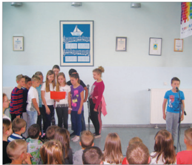
Zaključna prireditev programa Ekošola v šolskem letu 2018-2019

Na Osnovni šoli Cerkevjak–Vitomarci se je od leta 2003 skozi program Ekošola zvrstilo veliko število projektov: zbirali smo star papir, odpadne baterije in elektronsko opremo, pripravili radijske ure na temo trajnostnega ravnanja z okoljem, merili odtis CO 2 , se seznanjali o pomenu krožnega gospodarstva, odpadkom smo dajali novo življenje, mladi poročevalci so objavljali svoje članke v šolskem Ekolistu in pripravili radijske oddaje na temo varovanja okolja, sodelovali smo na ekokvizu, brali literaturo o okolju v projektu ekobranje za ekovivljenje ter izvajali številne druge aktivnosti, s katerimi smo želeli delovati trajnostno.