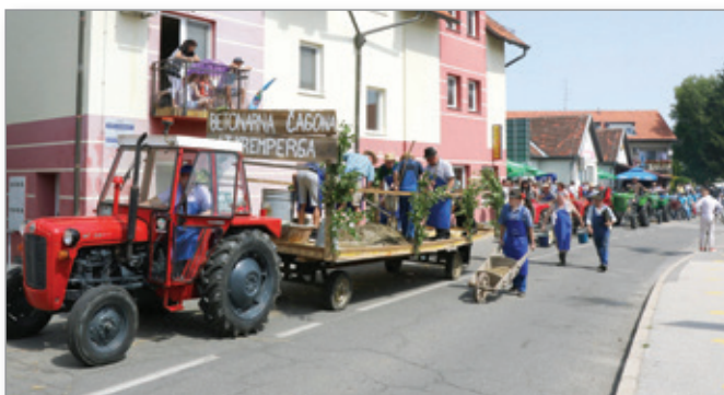
Tudi mešanje betona na roke je že zgodovina. S pomočjo te »tehnike« v ne tako davni preteklosti zgradili veliko hiš v osrednjih Slovenskih goricah.