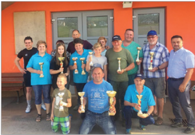
Skupinska fotografija ob občinskem prazniku

V mesecu oktobru se bodo na strelišču v Kadrencih spet pričeli redni treningi v streljanju z zračno puško. Lepo vabimo vse člane, da se nam na treningih pridružijo. Še posebej lepo pa so vabljeni vsi, ki bi se streljanja želeli priučiti na novo.