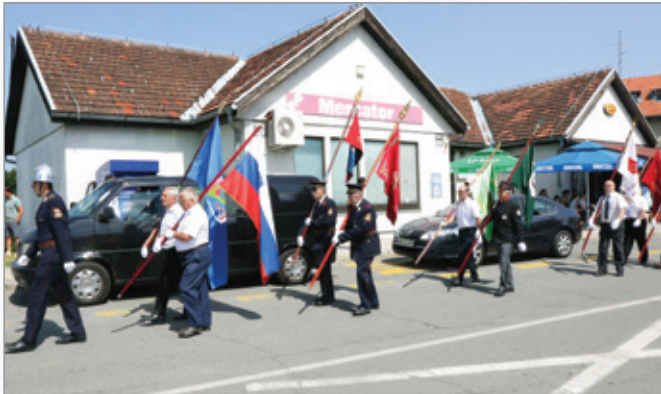
Kot vsako leto so tudi letos na čelu povorke ponosno korakali praporščaki.