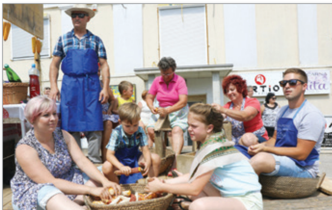
Luščenje koruze je šlo hitreje od rok, če so priskočili na pomoč še otroci, ki so morali v starih časih pri hišnih delih bolj sodelovati kot dandanes.