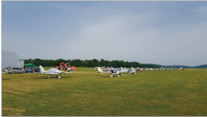
Obisk številnih letal iz cele Slovenije

V drugi polovici oktobra bo realiziran tudi tradicionalni koštanjev piknik v okviru srečanja letalcev.