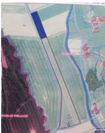
Načrti za dokup zemlje za podaljšanje vzletno-pristajalne steze so že narejeni.