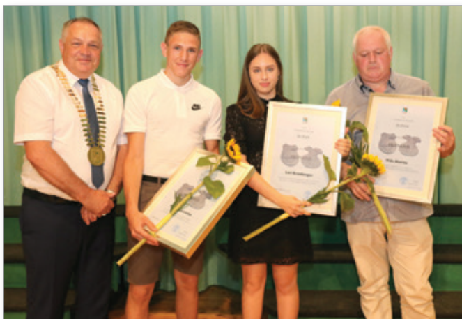
Dobitniki županovih priznanj