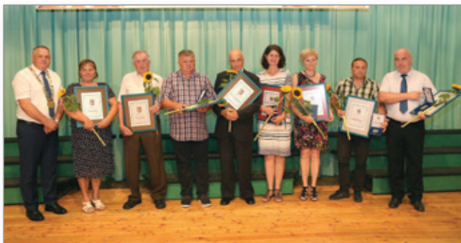
Najbolj zaslužni so prejeli priznanja Občine Cerkevjak.