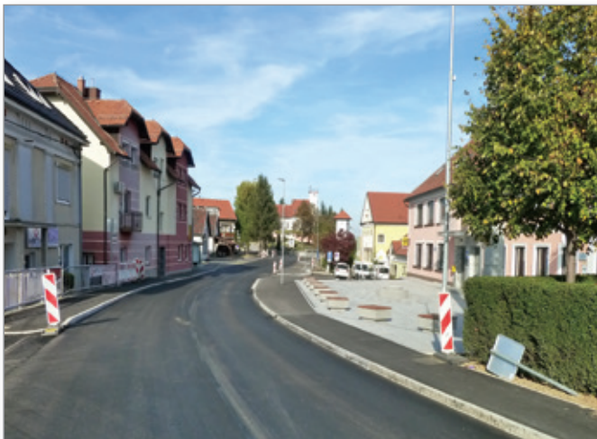
Cerkevjak po obnovi osrednjega trga

Zaradi ureditve trga bo Cerkevjak izgubil nekaj parkirnih mest pred zgradbo občine, ki pa jih bo občina takoj nadomestila z drugimi, ki jih že urejajo za občinsko zgradbo, nekaj parkirišč pa bo na novo urejenih tudi na lokaciji nekdanje avtobusne postaje nasproti trgovine Mercator.