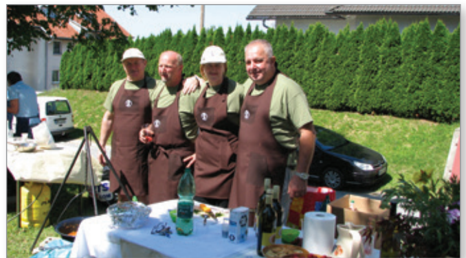
Kuharji imamo v svojih vrstah tudi krojačico, ki je poskrbela za našo prepoznavnost.

V Občini Cerkvjenjak deluje večje število društev. Leta 2010 smo ustanovili Društvo general Maister Cerkvjenjak, katerega namen je ohranjanje spomina na zgodovinsko delo Rudolfa Maistra in njegovih borcev za severno slovensko mejo s ciljem razvijanja in utrjevanja domoljubja na vseh področjih družbenega življenja. Društvo deluje na kulturnem, umetniškem, izobraževalnem, znanstvenem in športnem področju.