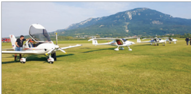
Udeležba na DP - letala pred poletom

Naše stališče je, da je potrebno izkoristiti ta veliki potencial, ki ga nudi samo vzletišče in v prihodnje intenzivno izvajati vse aktivnosti, da bo izvajanje obrambe pred točo iz Cerkevjenjaka ter obisk letal iz tujine naš vsakdan.