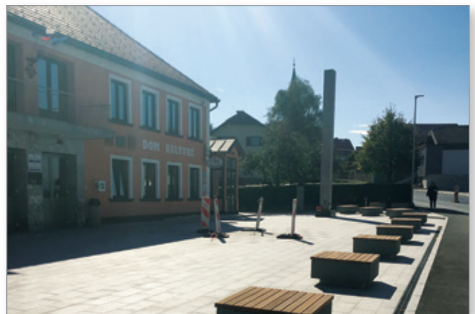
Tudi okolica Doma kulture bo po obnovi prijetnejša.