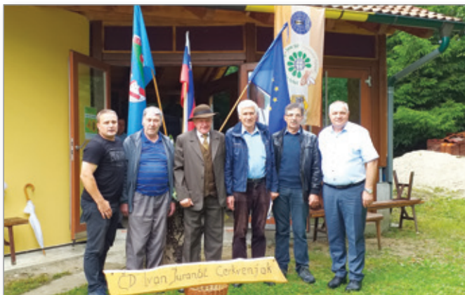
Ustanovitelji društva z županom

Jesen je tu, čebelarstva sezona je za nami. Letošnje nestanovitno vreme ni prineslo nič dobrega za čebele, naše marljive prijateljice. Še ena katastrofalna čebelarstva letina, to sedaj lahko že zagotovo rečemo, tako na našem ožjem območju kot v celi regiji in Sloveniji. Marsikateri čebelar je pridobil medu le za pokušino, nekateri pa še to ne. Pozno poletno in jesensko krmljenje je zagotovilo le golo preživetje in obstanek čebeljih družin. Zaenkrat upajmo, da bo tako ostalo.