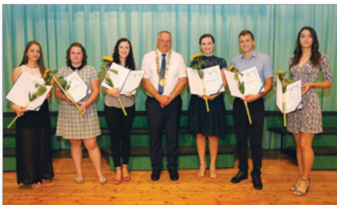
Diplomantke in diplomanti