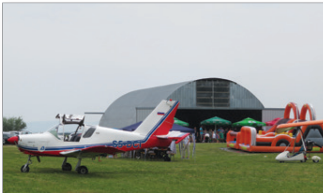
Aero klub Sršen vsako leto ob občinskem prazniku pripravi letalski dan, na katerem se zberejo s svojimi letali, motornimi zmaji in modeli piloti, modelarji in ljubitelji športnega letalstva od blizu in daleč. Naš posnetek je z letošnjega letalskega dneva.

Drugače pa v klubu potekajo aktivnosti za podaljšanje vzletišča v Čagoni, kajti projekt obrambe pred točo z letali, ki se je nekaj časa v juliju izvajal tudi iz vzletišča Cerkevjenjak in razvoj letalskega turizma že sama po sebi kličeta po podaljšanju vzletišča in sicer severno proti avtocesti za cca. 200 m. Obstoječe dimenzije ne omogočajo varnega letenja za tipe letal, ki se koristijo za protitočno obrambo z letali in tudi letala iz tujine, ki bi nas lahko obiskala imajo zahteve po daljši pristajalni stezi.