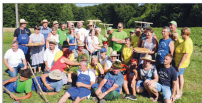
Skupna slika tekmovalcev ob skupni malici na travniku