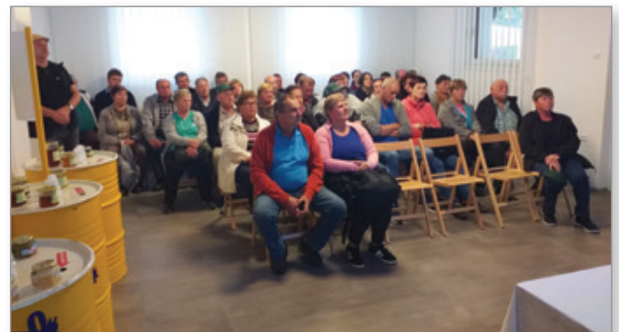
V Hiši medu Božnar