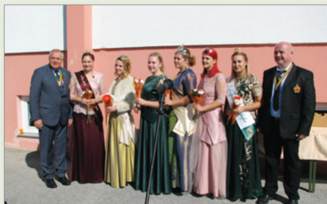
Pozornosti gospodarja so tudi tokrat bile deležne vinske kraljice.

Po trgatavi je sledila pogostitev ob občinskih stojnicah, ki so jo pripravili člani Društva kmečkih deklet in žena Cerkvenjak in člani Društva vinogradnikov in ljubiteljev vina Cerkvenjak.